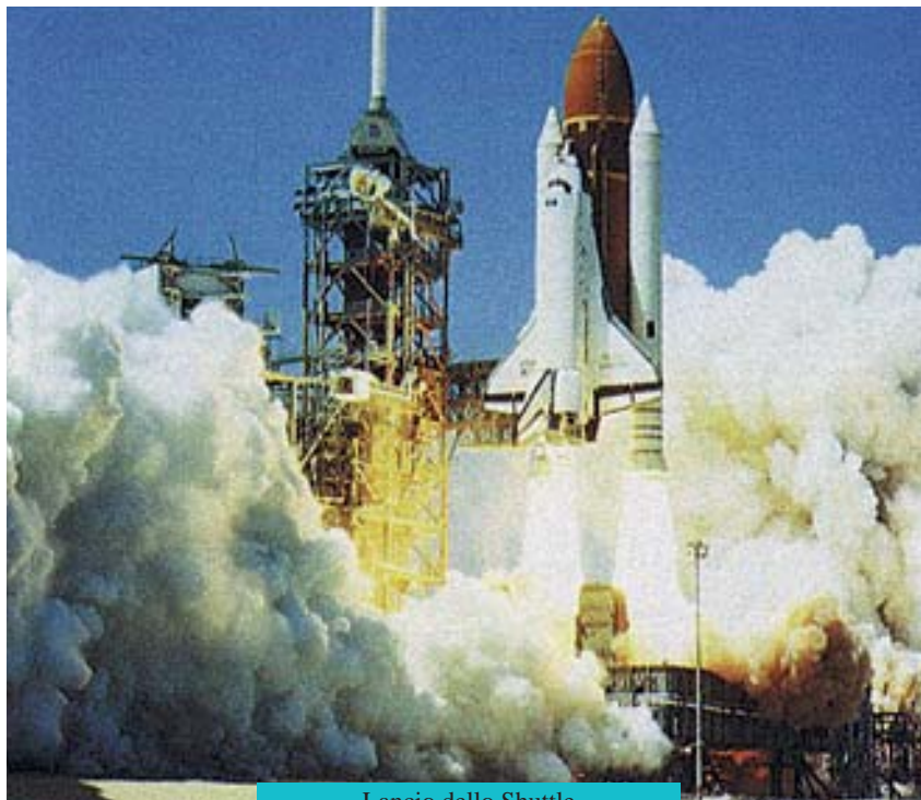
Lancio dello Shuttle

does one move and feel in these disorientated conditions? The answer to these questions: a mechanical arm designed to subject the astronaut to the simulated gravity-free conditions in which he will have to work. The astronaut is suspended from the mechanical arm and the speed and capacity of the movements transmitted to him are regulated according to his body weight, as he moves in the atmosphere created by a simulation cabin. These movements are defined by calculations transmitted to the arm motor which is operated at a rhythm identical to that of a man floating in outer space. A Bonfiglioli gear reducer regulates this movement with millimetric precision, supplying the mechanical arm supporting the astronaut with the exact degree of power required and preventing even the slightest jolt, with a smoothness which is so realistic that within a certain period of time the astronauts taking part in the exercises feel perfectly at home in weightless conditions. The quality of the Bonfiglioli trade mark has surpassed itself once again, with design precision, accurate proportioning of power and consistent results, the characteristics required of components such as the motor, and once again has fulfilled all expectations. We can certainly be satisfied with ourselves, knowing that man is able to explore the universe in perfect safety, with the help of a company striving, as always, not to let down those who have placed their trust in its performance.