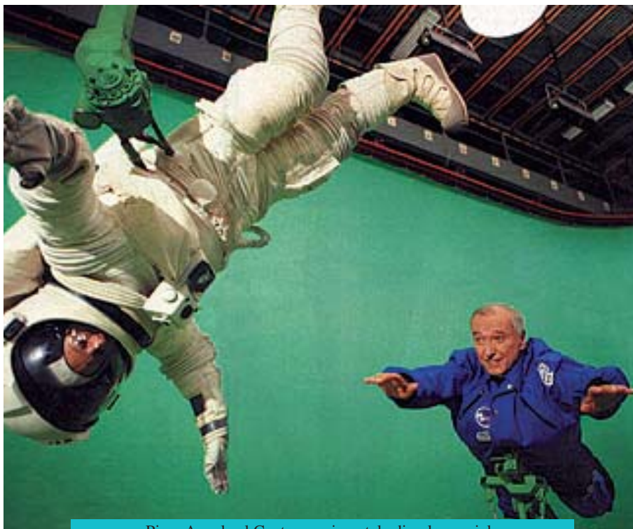
Piero Angela al Centro sperimentale di volo spaziale

as possible, the environmental conditions they will encounter once they leave the earth's atmosphere. Floating aimlessly without gravity, weight-less: a sensation that we certainly won't experience in our daily lives. How